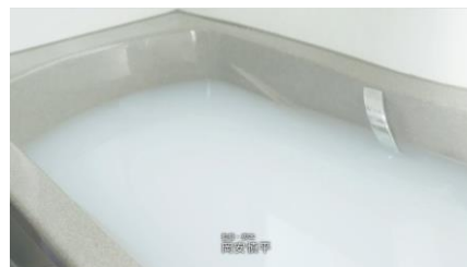
6. 全員忘れていたが、とうにお湯はりは完了