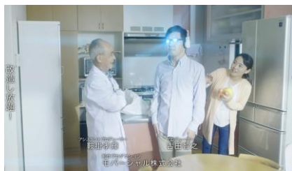
5. 旧式の湯太郎に新機能をアップデートする湯五郎