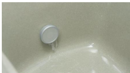
3. 自宅の風呂に自動でお湯はりが始まる