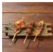
やきとり お壱樂 焼鳥3本セット 1,000円(8%税込)

海老3尾、舞茸、ししとう、茄子、のりの天ぷらをたっぷりご飯の上に乗せ、秘伝の丼たれで仕上げました。