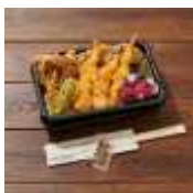
日本橋 稲庭うどんとめし 金子半之助 天丼弁当 880円(8%税込)

海老3尾、舞茸、ししとう、茄子、のりの天ぷらをたっぷりご飯の上に乗せ、秘伝の丼たれで仕上げました。