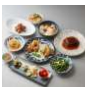
富錦樹台菜香檳(フージンツリー) 富錦樹テイastingコース(2名様~) 1名 5,500円(10%税込)

人気台湾料理レストラン 富錦樹台菜香檳の代表的な料理を前菜、魚料理、肉料理、デザートと存分に楽しめるテイastingコースです。1名様分ずつ盛り付けて提供いたします。※2名様から承ります。