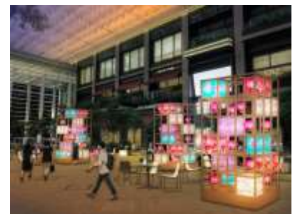
「COREDO室町テラス 大屋根広場」ライトアップ装飾CG