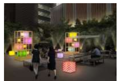
「福德の森」ライトアップ装飾 CG