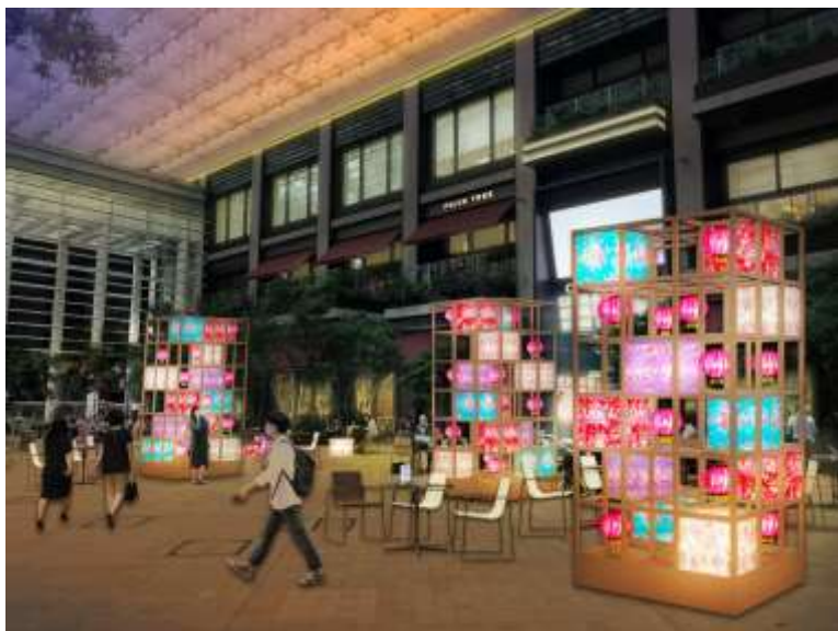
「COREDO室町テラス 大屋根広場」ライトアップ装飾CG

三井不動産が目指す「残しながら、蘇らせながら、創っていく」街づくりを体現する日本橋室町エリアは、それぞれ1周年・10周年の節目を迎え、日本橋ワーカーの皆さまや地元の皆さまとともに更にパワーアップいたします。この機会に歴史と新しさが融合する空間に、ぜひ足をお運びください。