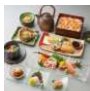
日本橋 かに福 周年記念限定コース 5,000円(10%税込)

人気台湾料理レストラン 富錦樹台菜香檳の代表的な料理を前菜、魚料理、肉料理、デザートと存分に楽しめるテイastingコースです。1名様分ずつ盛り付けて提供いたします。※2名様から承ります。