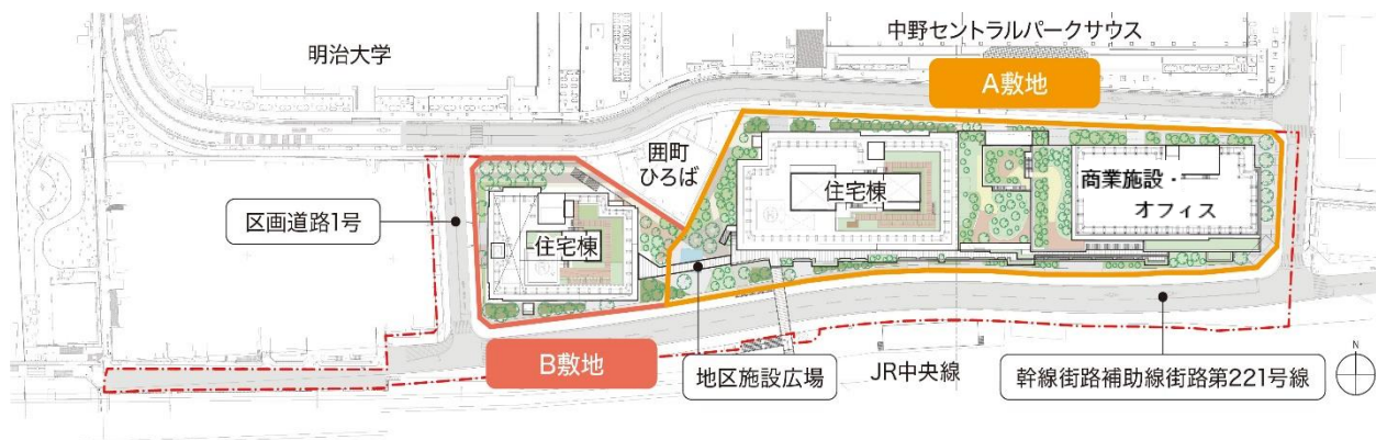
【施工区域図・建物配置図】