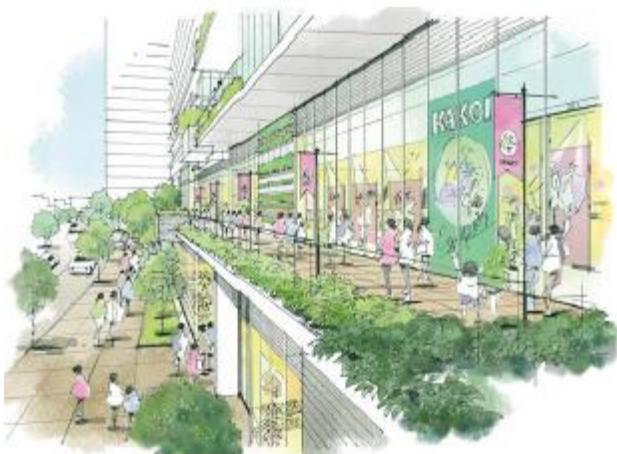
【2階デッキ商業イメージ】

約 1,000 m 2 の地区施設広場は、既存の区立「囲町ひろば」と空間的に連続して配置し、緑地による潤いと新たな賑わいを創出します。