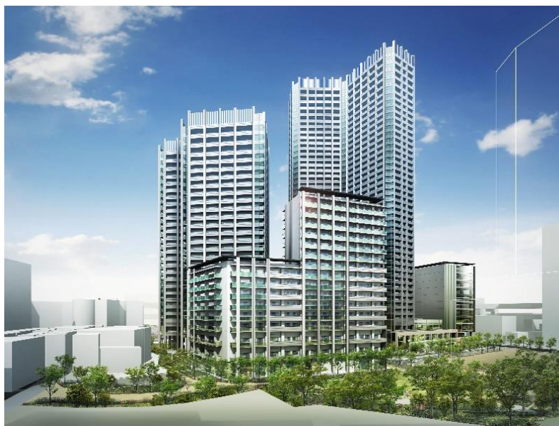
【建物外観完成予想 CG】

今後も、権利者の皆様とともに、2027年の竣工を目指し事業を推進してまいります。