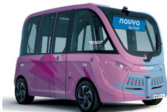
自律走行バス「NAVYA ARMA(ナビヤ アルマ)」

羽田みらい開発は、「NAVYA ARMA」と、自動運転車両の運行を遠隔地で管理・監視できるBOLDLYの自動運転車両運行プラットフォーム「Dispatcher(ディスパッチャー)」を活用して、構内移動の利便性を向上させるために無料の構内循環バスを運行します。自律走行バスは毎日午前10時半から午後4時半まで定期的に巡回する予定で、「HiCity」の来訪者であれば誰でも無料で乗車することが可能です。車両のラッピングは、施設コンセプトである先端産業＝青と文化産業＝赤紫の融合をイメージしてデザインされています。なお、「NAVYA ARMA」の輸入・販売およびメンテナンスのサポートはマクニカが行い、車両の信頼性の向上や安定した走行を実現します。