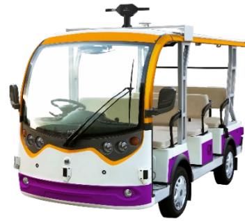
PerceptIn の自律走行低速電動カート

なお、「HiCity」内の人やモビリティ、ロボットなどのリアルタイム位置情報を集約する鹿島建設の空間情報データ連携基盤「3D K-Field」と「Dispatcher」の連携により、施設管理者は車両の位置情報などの運行情報を「3D K-Field」で確認することができ、今後車両運行管理業務の効率化に役立てる予定です。