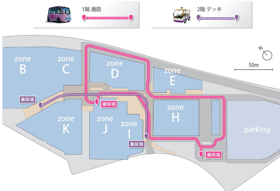
「NAVYA ARMA」と自律走行低速電動カートの運行ルート