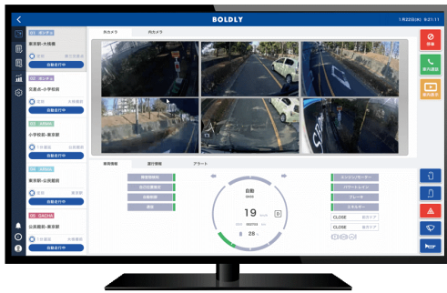
自動運転車両運行プラットフォーム「Dispatcher」画面