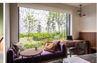
三井ガーデンホテル 豊洲ベイサイドクロス