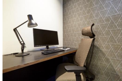
ワークスタイリング SHARE 一人用個室