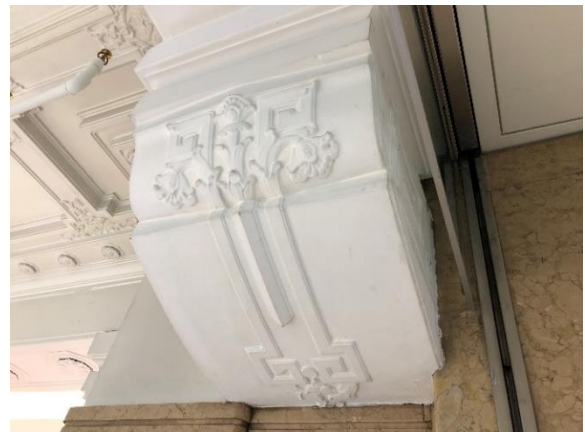
日本橋高島屋 S.C.本館入口の吹き抜けに面する 柱頭の肘木風モチーフ

江戸時代より経済・文化の中心地として栄えた日本橋は、かつて全く新しい風景を出現させた最先端の地でした。日本橋高島屋をはじめとし、周辺には日本橋三越本店本館、日本銀行本店本館、三井本館など、ヨーロッパに学ぶ本格的な古典主義の建築が多数残っていることから、それは明らかです。また近年、日本橋は新たな再開発が進む街として注目されています。