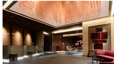
三井ガーデンホテル六本木プレミア