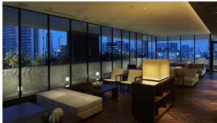
三井ガーデンホテル大阪プレミア