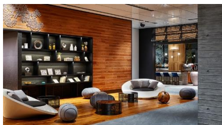
三井ガーデンホテル神宮外苑の杜プレミア