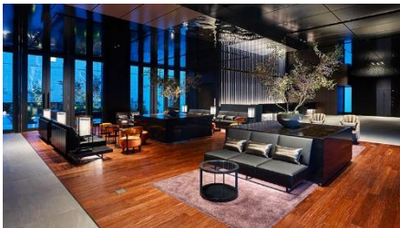
三井ガーデンホテル日本橋プレミア