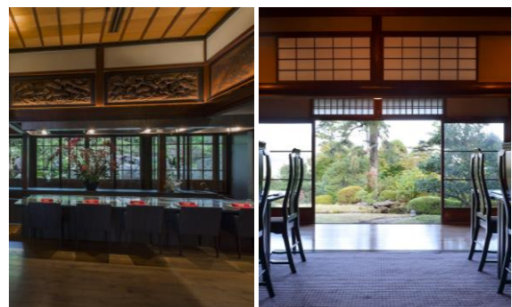
【鉄板焼・しゃぶしゃぶ「迎賓館」／蕎麦「貴賓館」】