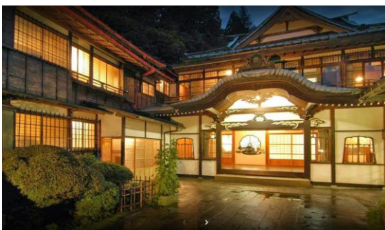
【国登録有形文化財建造物「本館」外観】