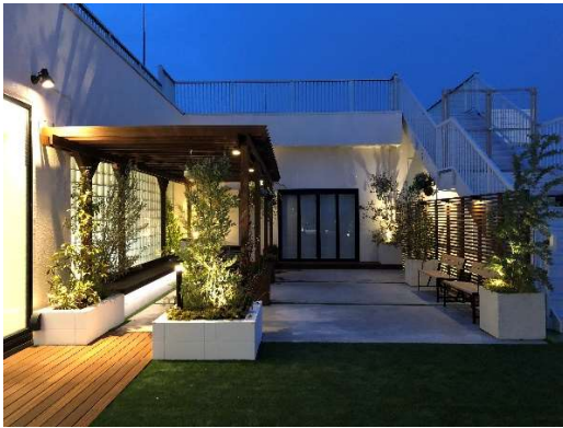
ライトアップの様子