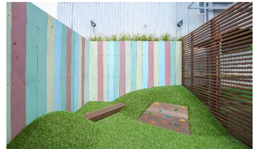
パーゴラ（上）／キッズスペース（下）

JR 松戸駅は都内へのアクセスも良く、一日の平均乗降者数は約 10 万人（2019 年度）と、千葉県内でも有数の利用者数を誇ります。「アトレ松戸」はビジネスマンからシニア、子ども連れの家族などが幅広く利用する駅直結の商業施設であるため、子どもが思い切り遊べる芝エリアや大人がリラックスして過ごせるパーゴラエリアを設け、来訪者や地域居住者にとって憩いの場となるような屋上庭園を目指しました。