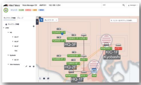
●ネットワークマップ

有線ネットワークを一元的に管理する AMF (Autonomous Management Framework) マスター機能に対応します。また、LAN と WAN を統合して機器や通信の状態を表示することも可能なマップ表示機能を備えています。