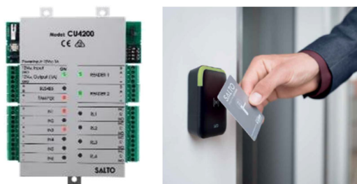
SALTO XS4 シリーズ “CU（制御装置）”（左）。 専用のカードリーダー（右）をユーザーインターフェースとして、 他社製の設備の制御を可能にする

SALTO の最大の特長は、自身の製品群だけでなく、他社製の設備の制御までも可能にする点にあります。防犯設備としては電気錠やカメラ、生体認証装置、警備システム等、施設の設備としてはエレベーターや自動ドア、セキュリティゲート等、数多くの設備の管理をサーバで一元的に行うことができます。他社製の設備の制御には、CU を利用します。