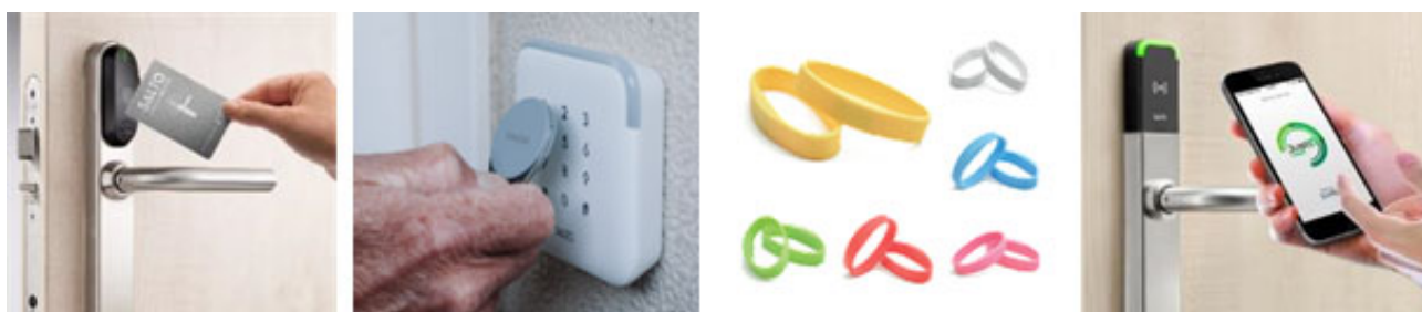
SALTO の認証キー。IC カード（左）の他、タグ型（中央左）やプレスレッド型（中央右）、スマートフォンのアプリ等、シチュエーションや用途に合わせて様々な種類を選択できます。

認証に必要なキーは IC カードの他、用途によってタグ型やプレスレッド型のキーをお選びいただけます。その他、キー自地からキーをダウンロードする等、そもそもキーを持ち歩かない運用方法を選択できることも、SALTO の強みです。