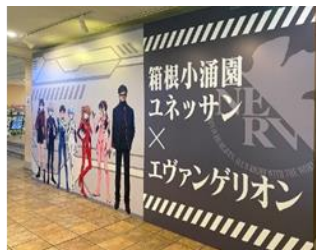
4階総合フロント (入園料不要)