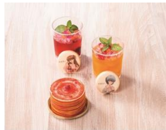
箱根小涌園 スイーツ&ペーカリー (7月23日リニューアルオープン)