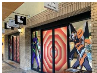
正面玄関 (入園料不要)