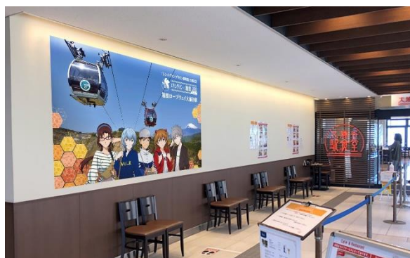
▲写真撮影スポット(イメージ)