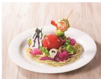
箱根小涌園 大文字テラス (7月4日リニューアルオープン)