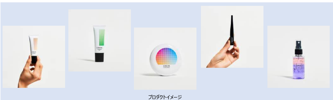
プロダクトイメージ