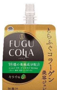
【とらふぐコラーゲン美容ジュレ】 ～キウイ味～

とらふぐは、ふぐの中でも高価なため、ふぐ料理店などでは「ふぐの王様」とも呼ばれています。ただ、近年資源量が減少しており、水産庁でも「トラフグ資源管理検討会議」を立ち上げ、対策を検討しているほど希少価値のある魚となっています。そのため、養殖技術の研究開発も盛んに行われています。