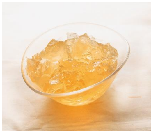
【抽出されたコラーゲン】