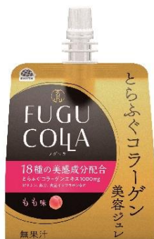
【とらふぐコラーゲン美容ジュレ】 ～もも味～

アース製薬株式会社（本社：東京都千代田区、社長：川端克宜、以下「アース製薬」）は、希少な高級魚とらふぐの良質なコラーゲンを原料とした「とらふぐコラーゲン美容ジュレ」（もも味、キウイ味の2種類）を、全国展開するドラッグストアで6月1日より限定発売いたします。