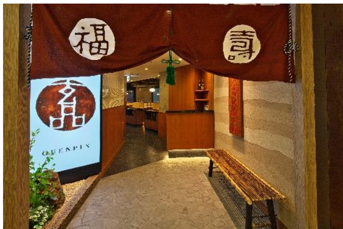
【とらふぐ料理専門店「玄品」店舗の様子】

今回パートナーシップを結んだ関門海が運営するとらふぐ料理専門店「玄品」では、独自の熟成技術で「旨味」を引き出しています。「とらふぐコラーゲン美容ジュレ」では、この「玄品」で提供されている、旨味を封じ込めたとらふぐから抽出したコラーゲンを使用。また、「玄品」が持つ独自のイオン化ミネラル処理技術も活用して、コラーゲンの体内への吸収効率を向上させています。