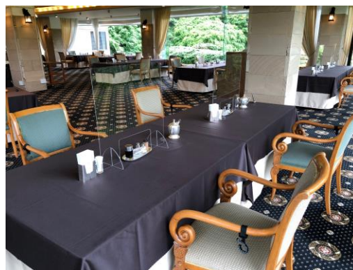
カメラヒルズカントリークラブ フロント・レストランでアクリル板を設置