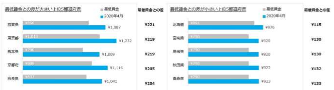
【図3】都道府県別 平均時給と最低賃金差 (一部抜粋)