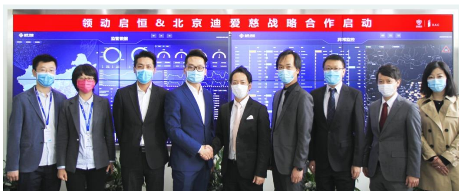
両社代表は QiHeng データダッシュボード前に撮影