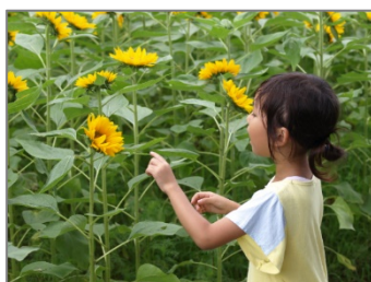
お顔見せて／るいたんさん