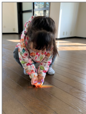
そおーっと、虹をすくおう／ぴーなっつきん