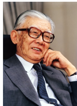
ソニー創業者 井深 大

2011年に「公益財団法人 ソニー教育財団」となり、幼児期から中学生までの「科学する心を育てる」こと、「科学が好きな子どもを育てる」ことを柱にした教育助成を行っています。教育助成の他、“自然に学ぶ”をテーマに探究する小・中学生対象の「科学の泉ー子ども夢教室」、親子の絆を育む「“科学する心“を見つけよう フォトコンテスト」など、未来を生きる子どもたちへのさまざまな支援活動を行っています。