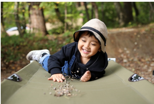
おもちさん (福島県)