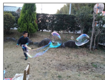
やった！なが～くできた／pooh さん

きらり賞(39 作品)および入選作品の詳細は、ソニー教育財団のウェブサイト( https://www.sony-ef.or.jp/ )をご覧ください。2020 年度は、各地の科学館などで、入選作品の写真展開催を予定しています。開催時期が決まり次第、ウェブサイトに掲載いたします。