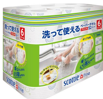
プリント 52カット 6ロール

『スコッティ®ファイン 洗って使えるペーパータオル』は、布のように絞ることができ、洗って繰り返し使用できる丈夫なペーパータオルです。通常のキッチンペーパーと比べ、濡れた状態の強度が優れているため、食器を拭いたり、食卓やテーブル、キッチンのシンク周りやガス台を拭いたりするときにおすすめの商品です。例えば、食器を拭いたのちに水洗いをしてテーブルを拭き、もう1度水洗いをして最後はキッチン周りのお掃除に使うなど、1回で使い捨てるのではなく、丈夫なので繰り返し使うことができます。