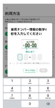
車両ナンバー情報を登録