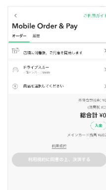
オーダーを確定/決済