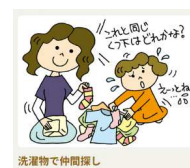
洗濯物で仲間探し