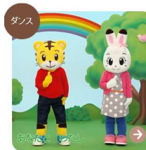
おおきなりのきのしたで