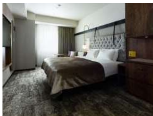
客室(アクセシブルクイーン)