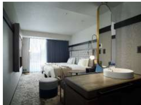
客室(コンフォートツイン)