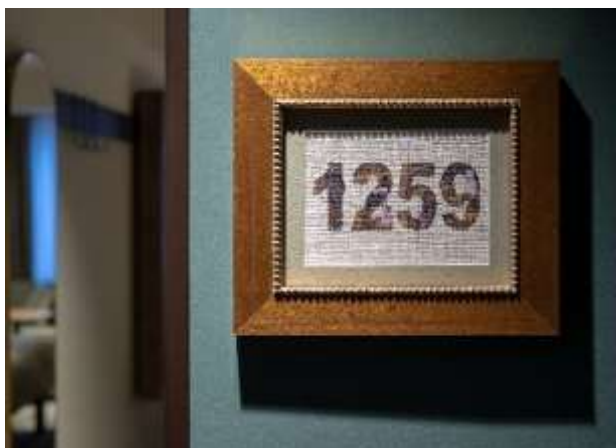
部屋ごとにデザインの異なるルームナンバー