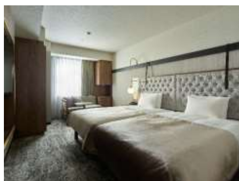
客室(モデレートツイン)