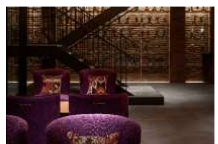
ラベンダーを想起させるソファ