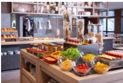
朝食ビュッフェ(イメージ)