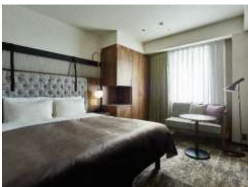
客室(モデレートクイーン)

※全室禁煙(館内に喫煙室を設置しております。)。 ※1ソファベッド1台追加可 ※2 エキストラベッド2台追加可