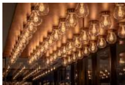
吹きガラスをモチーフとした天井照明