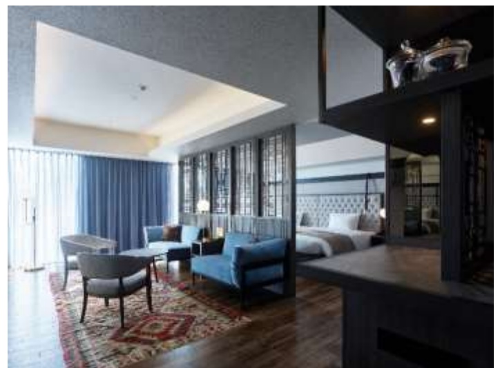
客室(ジュニアスイートツイン)