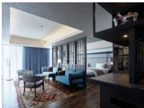
客室(ジュニアスイートツイン)