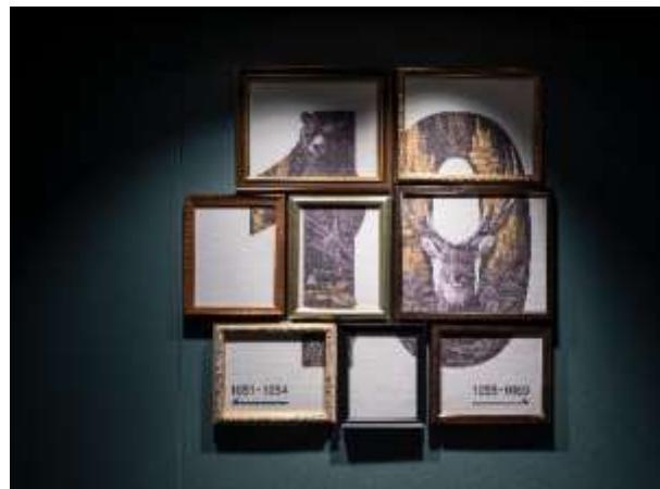
各階ごとにデザインの異なるフロアナンバー