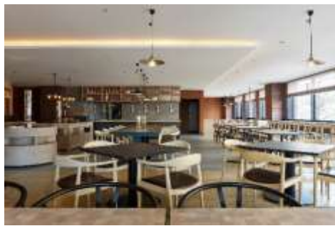
カフェレストラン(店内)