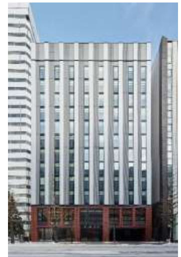
建物上部と基壇部とのコントラスト