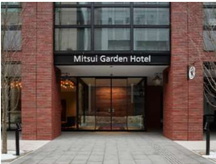
北海道の象徴的建築を連想させるレンガを基調とした外観デザイン

建物の基壇部には北海道で長く親しまれてきたレンガやガス灯をデザインとして取り入れ、ワンランク上の風格と温もりを持ってお客さまをお出迎えします。建物の上部はモノトーンのデザインとして、基壇部とのコントラストを創り出すことで、北海道らしい郷愁を覚えるだけでなく、他にない新しさを感じる建物となっています。