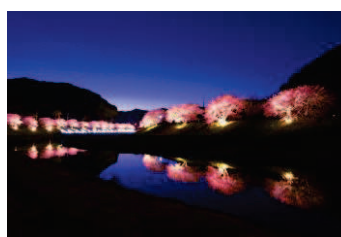
■夜桜ライトアップ