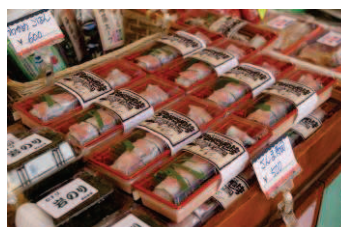
■露店に並ぶ地場産品

また、散策コースにある、約3ヘクタールもの広大な休耕田を利用した「日野(ひんの)の菜の花畑」では、黄色いじゅうたんのように広がる菜の花畑に囲まれた写真撮影ができ、人気のインスタスポットとなっています。