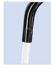
スプレーシャワー 吐水画像