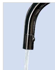
ストレート 吐水画像

ドイツの高級水栓金具メーカー「グローエ社」との 共同開発モデルF914シリーズのクロムブラックカラー