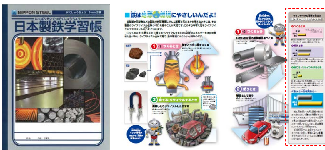
図3 「日本製鉄学習帳」の一部ページ

日本製鉄は、常に世界最高の技術とものづくりの力を追求し、国連で採択された「持続可能な開発目標」(SDGs)にも合致した活動を通じて、これからも社会の発展に貢献して参ります。