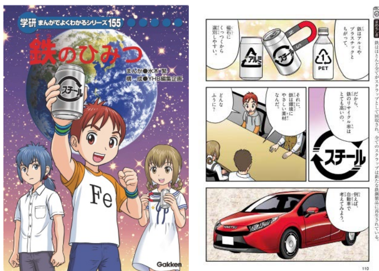
図2 学習漫画「鉄のひみつ」の表紙と内容の一部