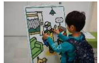
＜前回実施の様子＞ 上)裏ワザ防災グッズ 下)水害着せ替えゲーム