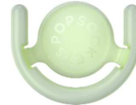
Glow in the dark