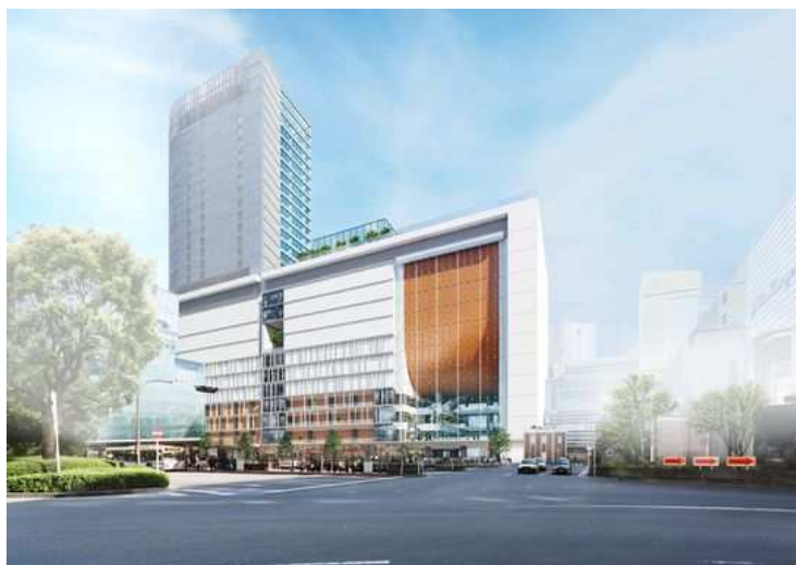
<JR 横浜タワー ニューマン横浜 外観>