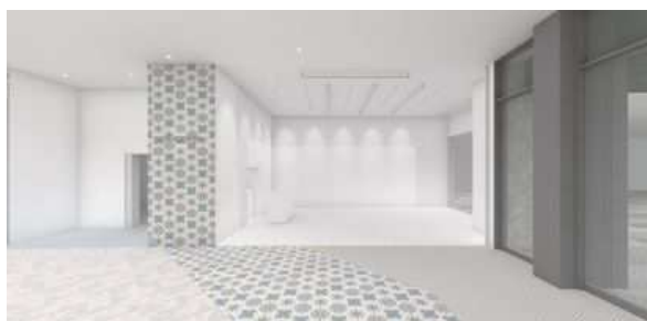
<1F NEWoMan Lab.>