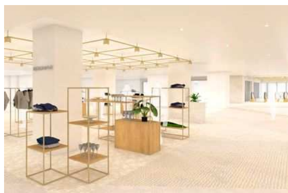
<7F NEWoMan Lab.>