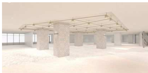
<5F NEWoMan Lab.>