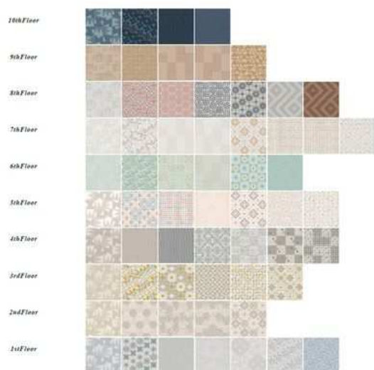
<各階フロアタイルイメージ>