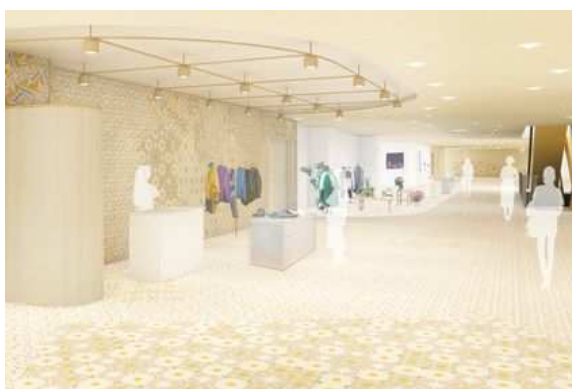
<3F NEWoMan Lab.>