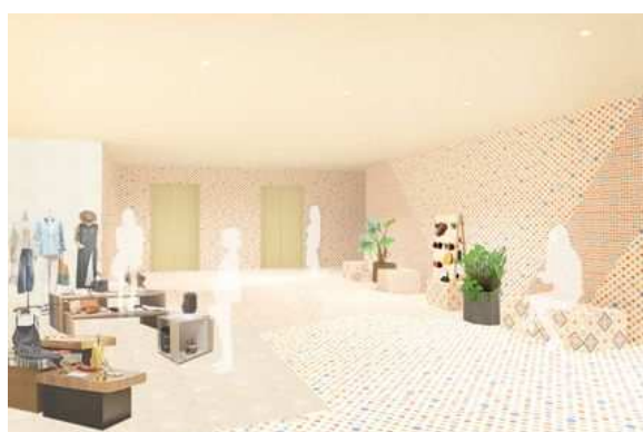
<5F エレベーターホール>