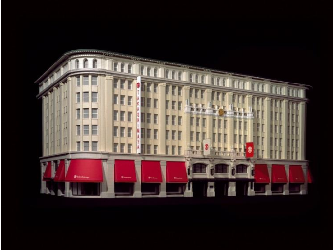
屏風 高島屋(170.0×230.0 cm、和紙にインクジェットプリント)