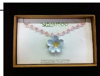
<バンブージュエリー誓いのさくら-CN(クリスタルネックレス)> ¥9,240(税込)

有楽町店 ルミネ 1 7F「ザ・スタディールームコレクション」では、アメリカのデザイナー スティーブ・キング氏が“生物の美しさ”をアクセサリで表現するブランド「バンブージュエリー」から、東日本大震災後、同氏が“日本の桜”をイメージして、新たに数量限定で製作した「誓いのさくら」シリーズを販売いたします。売り上げの一部が、東日本大震災の被災地支援に使われるチャリティジュエリーです。なお、チャリティ商品のギフトボックスには、“奇跡の一本松”がデザインされています。