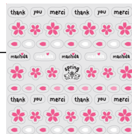
<桜のネイルシール>

ルミネ町田では、プロジェクト期間中、「募金箱」(2F インフォメーション横に設置)へ、募金してくださった方(金額問わず)に、貼るだけで気軽にネイルアートができる「桜のネイルシール」を先着 2,500 名様に無料で配布いたします。手元・足元でも、軽やかな春の装いをお楽しみください。