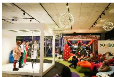
YogiboStore 御堂筋本町店内でのイベントの様子