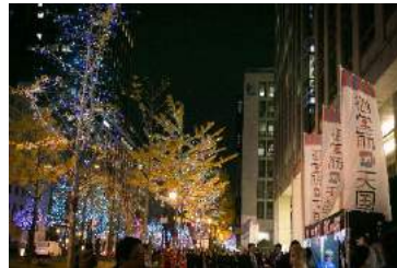
「御堂筋天国 OTONA CHRISTMAS Night」開催の様子