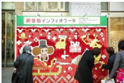
御堂筋インフィオラータ