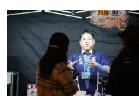
関西の食材を活かしたグルメ、ホットワインや温かなお酒を提供