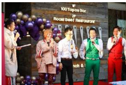
芸人によるトークショー&漫才