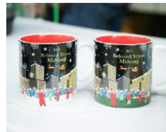
御堂筋天国オリジナルマグカップ