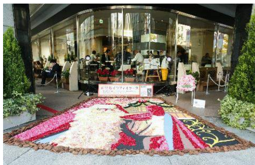
アーティストによるインフィオラータ装飾 (大阪ガスビル前)