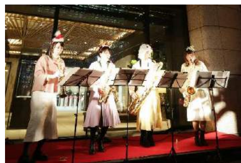
相愛大学卒業生によるサクソフォンカルテットコンサート