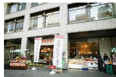
MEAT DINING River:Ve 前の様子