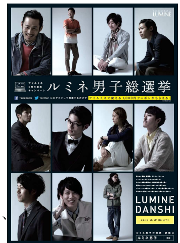
<ポスタービジュアル>

ルミネでは、ワクワク感を提供するとともに、リアル店舗とネット通販の連携を図り、お客さまのさらなる利便性の向上に努めて参ります。