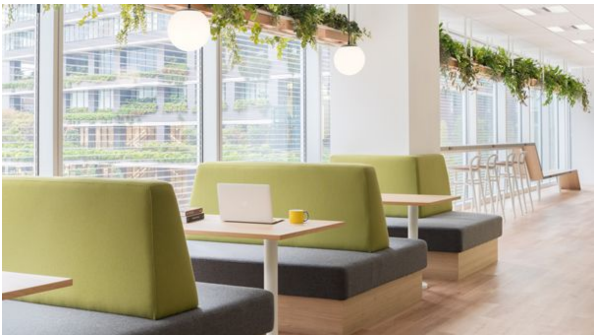
気軽に会議を行えるミーティングスペース（手前）と気分を変えて仕事ができるカウンター席（奥）