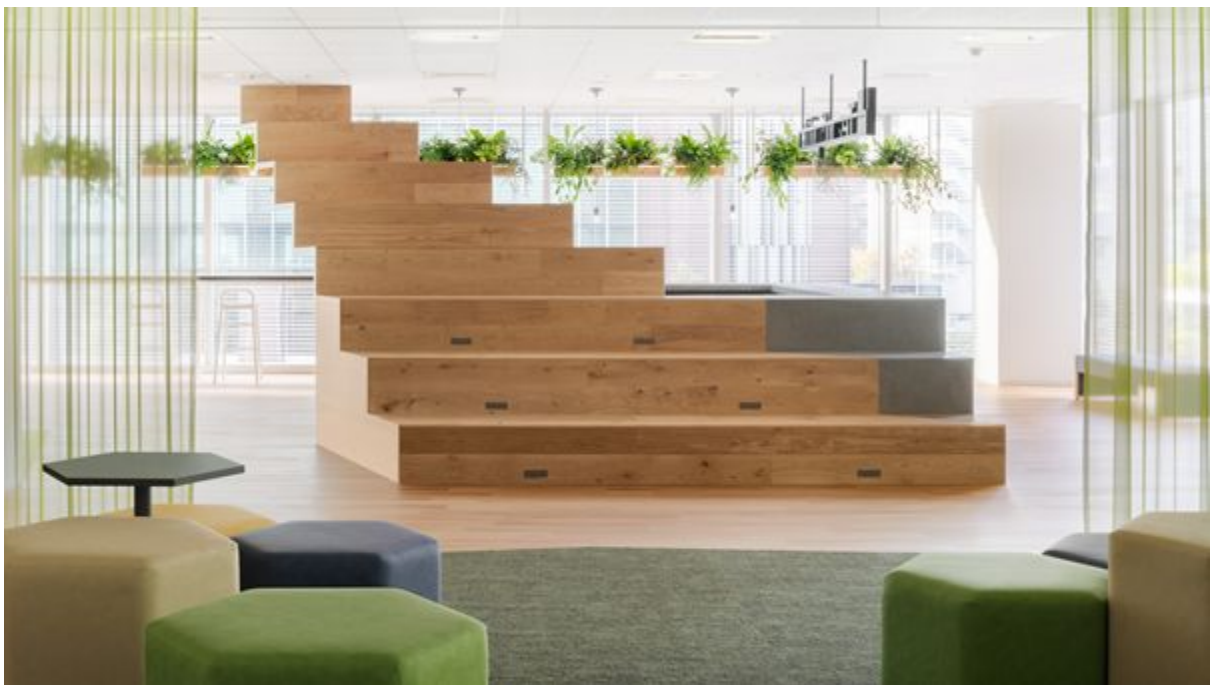
4Fと6Fの上下階をつなげることを連想させる階段状のカフェカウンターデザイン