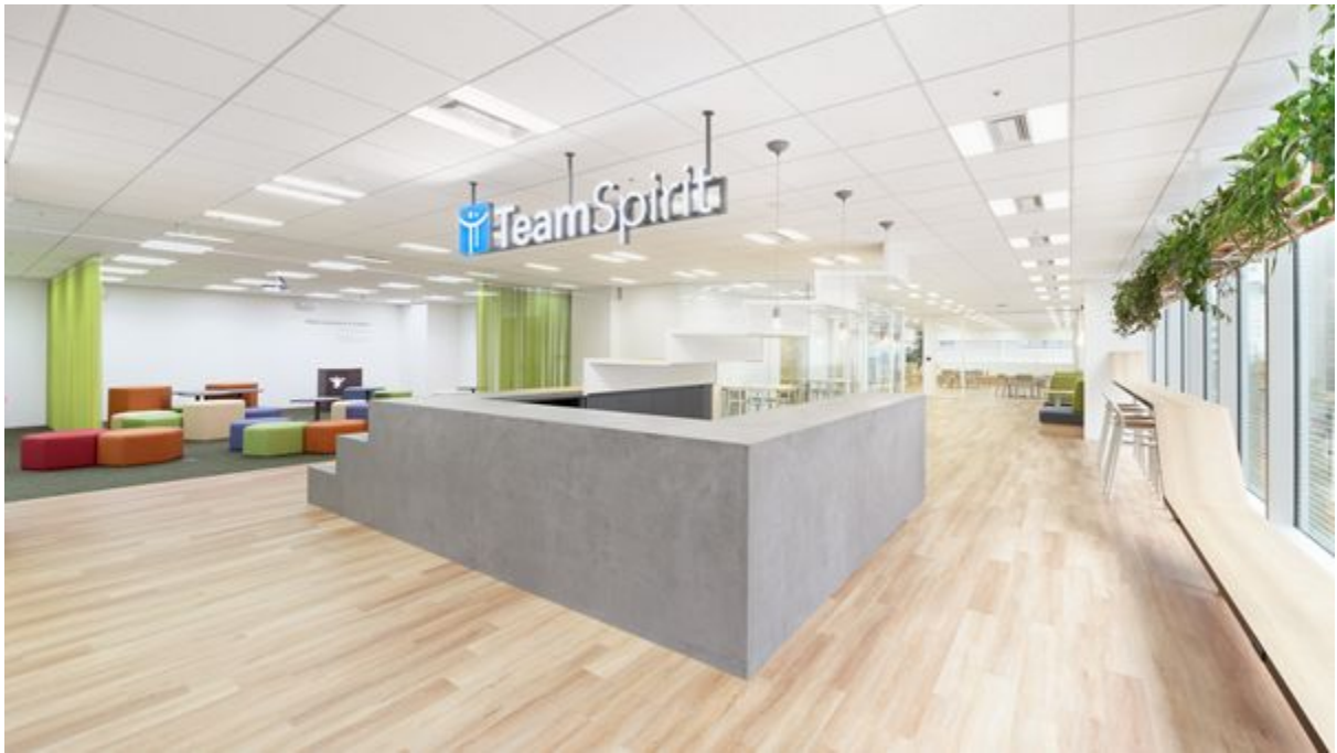
自然と人が集まるカフェカウンターを中心としたコラボレーションフロア（手前）。来客スペースとの境界を曖昧にし、空間に広がりを持たせた執務スペース（奥）