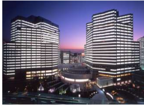
ゲートシティ大崎 夜景

「ゲートシティ大崎」は、地上 24 階建の業務商業棟（オフィスタワー 2 棟と低層部の店舗・文化施設）と地上 20 階建の住宅棟「サウスパークタワー」を中心に多彩な都市機能が集積した複合再開発です。