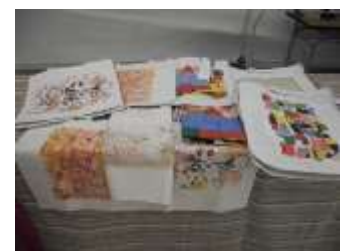
手作りイラストが プリントされたトートバック