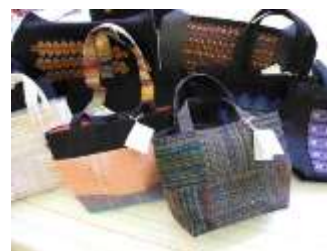
「さをり織り」バック