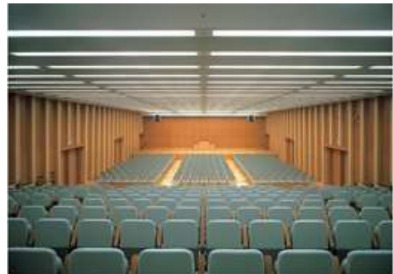
ゲートシティホール