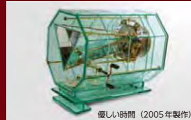
優しい時間 (2005年製作)