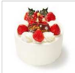
フルーツチュール タカノ