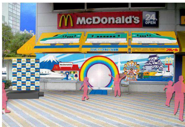
【店舗外観(イメージ)】

「プラレール」の世界観を表現するために、店内は壁面に「プラレール」の装飾を施し、店舗外観も遠くからでも一目で分かるような迫力ある装飾をいたします。店内には、ジオラマ展示から、入り口から床面に「プラレール」のレールデザイン、レールで作られた日本地図など、来て見て楽しめる展示を行っております。