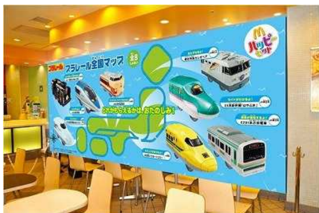
【「プラレール」のレールで作られた日本地図(イメージ)】