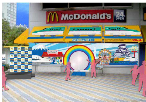
【店舗外観(イメージ)】

「プラレール」の世界観が溢れる「ハッピー・プラレール店」に是非一度お越しいただき、マクドナルドと「プラレール」のコラボレーションをお楽しみいただければと思います。