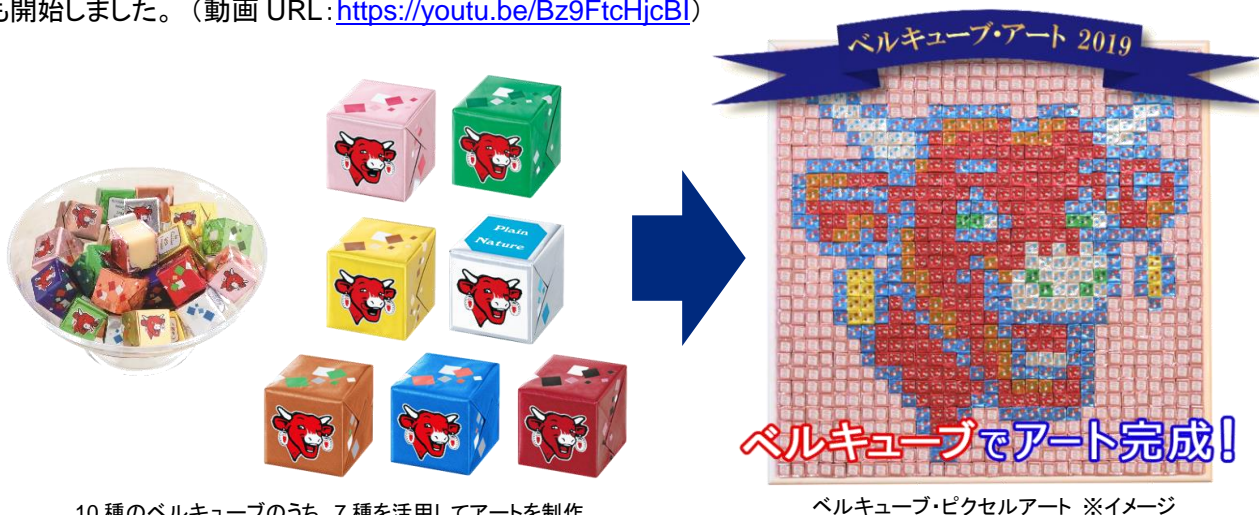
10種のベルキューブのうち、7種を活用してアートを制作

ベル ジャパン株式会社(所在地: 東京都港区 代表取締役: Francois-Xavier Moreau フランソワ・グザビエ・モロー)は、ルービックキューブアートの世界第一人者である頭脳派パフォーマー シンクロシティと初のコラボレーションを行い、10種類のフレーバーが楽しめるチーズキューブ「ベルキューブ」を活用したベルキューブ・アートを開発。本日、制作した動画を公開し、Twitter( @belcube_jp )では動画公開記念フォロー&RTキャンペーンも開始しました。(動画 URL: https://youtu.be/Bz9FtcHjcBI )