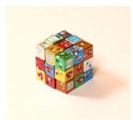
3Dアート “立体パズル”