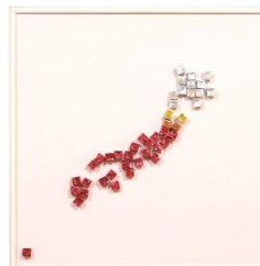
日本列島 今年の暑さを表現!