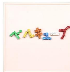
文字アート “ベルキューブ”