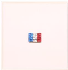
ベルキューブの 故郷フランス国旗