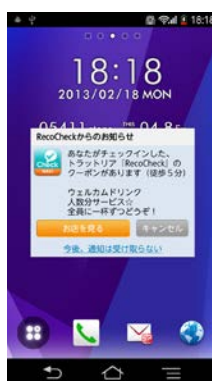
▲PUSH 型通知による情報配信のイメージ画面の例です。