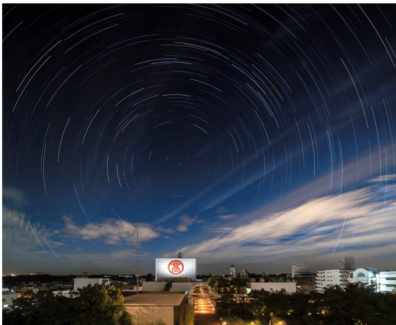
〈たまがわ〉の「空」 玉川高島屋 S・C の上空に輝く北極星