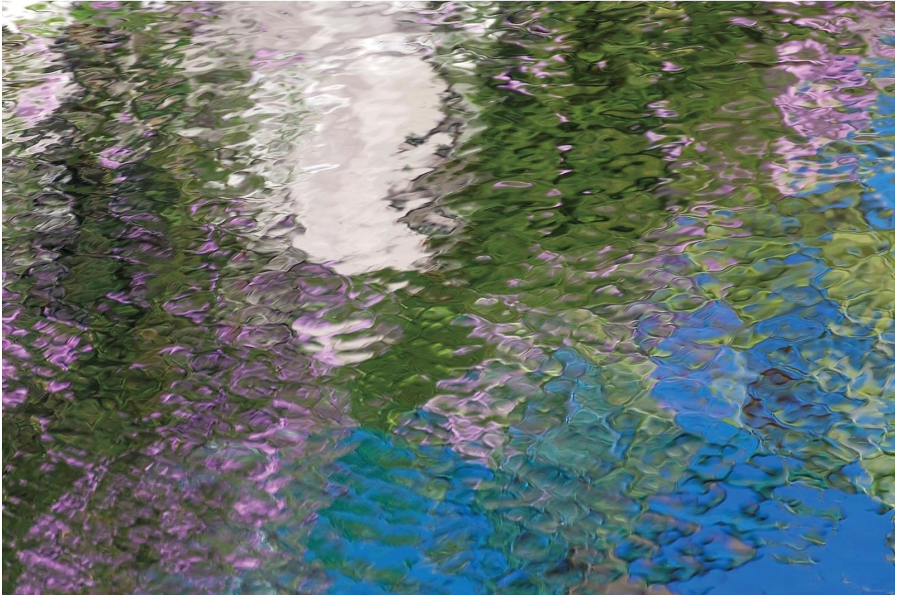
〈たまがわ〉の「ゆらぎ」『ゆらぎ - 水面 - 』2013 ©Koshu ENDO