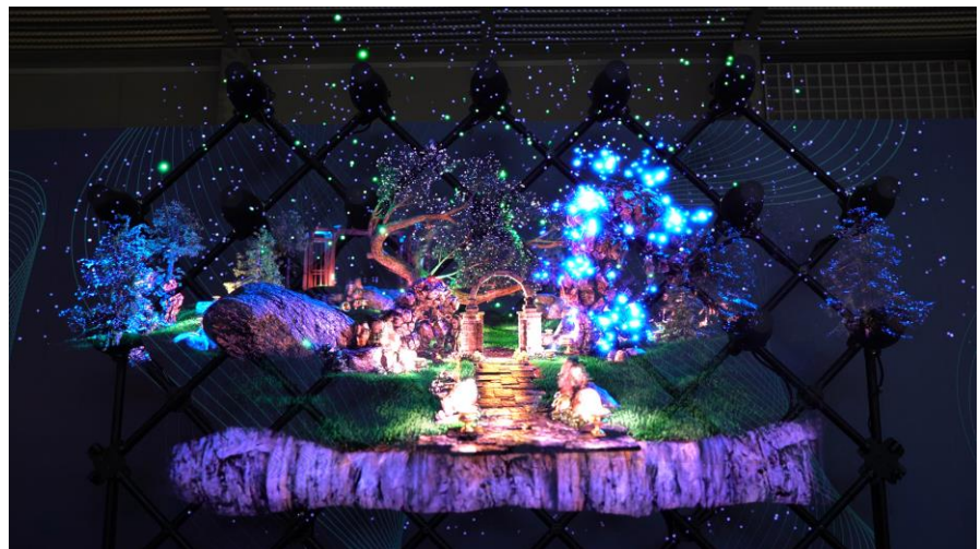
< 例：投影装置33台の連携による、約7m 2 の大型立体映像 >