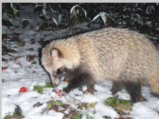
食物供給と哺乳類の食性