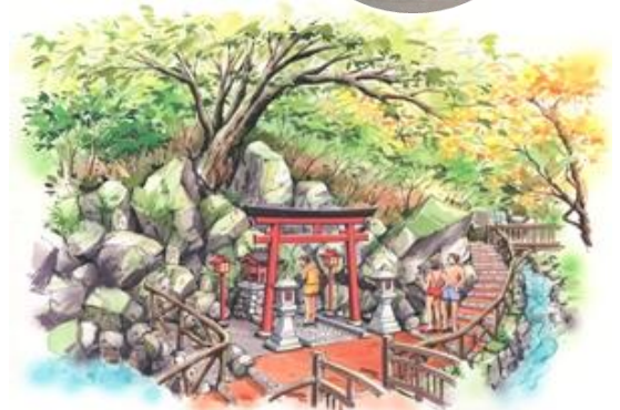
「箱根温泉神社」イメージ

湯〜とびあエリアで、最も「自然の情緒」を満喫できる「かけ流し温泉」を復活させ、箱根の雄大な自然をお楽しみいただけます。