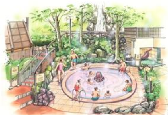
「縁むすび風呂」イメージ