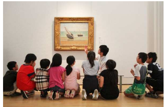
毎年実施している子ども向け対話型鑑賞会

「シンコペーション:世紀の巨匠たちと現代アート」展が開幕する2019年8月10日から、子供たちにとって芸術鑑賞を身近なものとしていただくために、中学生以下の入館料を無料に変更します。また開館以来十数年実施している対話型鑑賞会「キッズ☆おしゃべり鑑賞会」を軸に、絵本のクッションコーナーやうちわづくりのワークショップが無料で楽しめる、「夏休みこどもウィーク」を開催します。