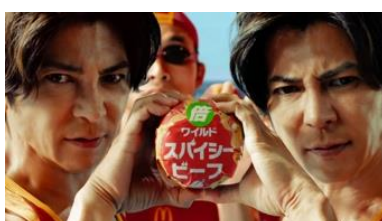
武田さん 「パティ倍で…」