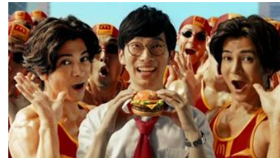
若いサラリーマン 「これヤバイ！」