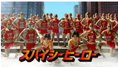
NA: スパイシーヒーロー