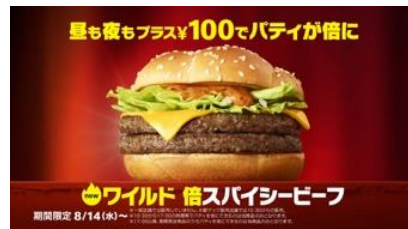
NA: 倍スパイシービーフ