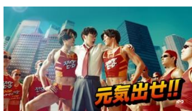
武田さん 「元気出せ!!」