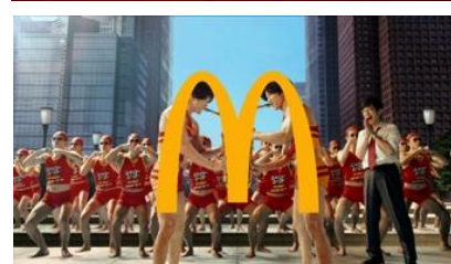
若いサラリーマン 「上手〜！」