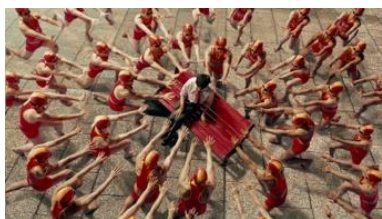
若いサラリーマン 「えええ！」