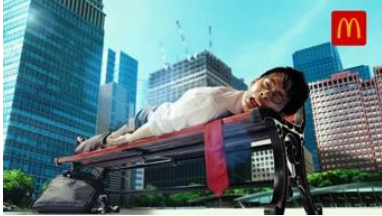
若いサラリーマン 「暑さヤバイ！」