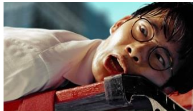
若いサラリーマン 「えっ、ぼっ」