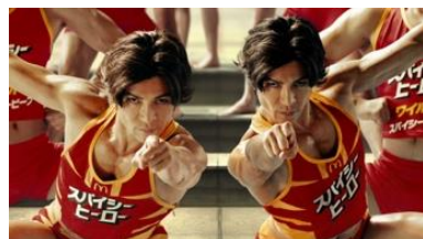
若いサラリーマン 「倍に増えてる！」