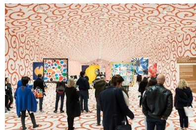
FUROSHIKI PARIS (2018・パリ市庁舎前広場)