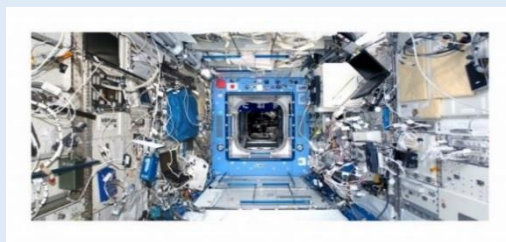
＜表面＞ISSの「きぼう」にある窓を実寸大で表現 ＜裏面＞「きぼう」棟内を表現。宇宙唯一ののれんも掲出