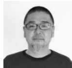
野老 朝雄 美術家