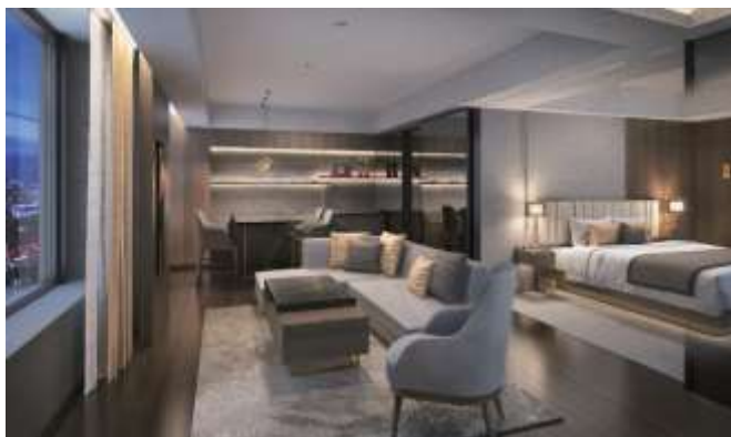
ジュニアスイート(約 60 m 2 )

また、館内には宿泊者専用の最新機器を導入したフィットネスジムを設け、ゲストの滞在時間をより上質な時間へと誘います。