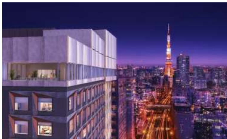
レストランフロアからの眺望

ホテル最上階となる14階には、東京タワーや六本木ヒルズ等、都会ならではの夜景を一望できるレストランを設けております。モーニングタイムでは自然光が降り注ぐ気持ち良い空間でセミビュッフェスタイルのご朝食を提供し、ディナータイムではバーカウンターから夜景をお楽しみいただきながらゆっくりとお寛ぎいただける空間を提供いたします。