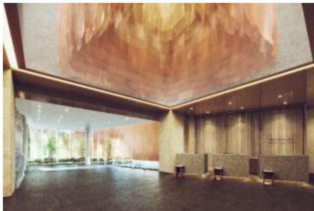
エントランスロビー

1階のエントランスロビーは自然光が差し込み、彩り豊かな外構の植栽や水盤・アクアウォールにより開放感ある爽やかな空間となっております。また、インテリアには特殊な加工を施したファブリックアートを配し、柔らかな演出でゲストをお迎えいたします。