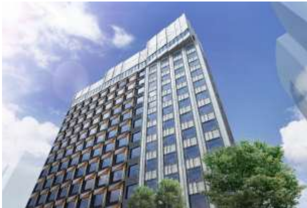
当ホテルを見上げた眺望

外観は、寄木や折紙、屏風のような「和」をモチーフに取り入れ、細やかな陰影を演出することでインバウンドのお客さまにも日本らしさを感じていただけるデザインとし、季節や時間によって刻々とその表情を変え、六本木の街並みに彩りを与えます。