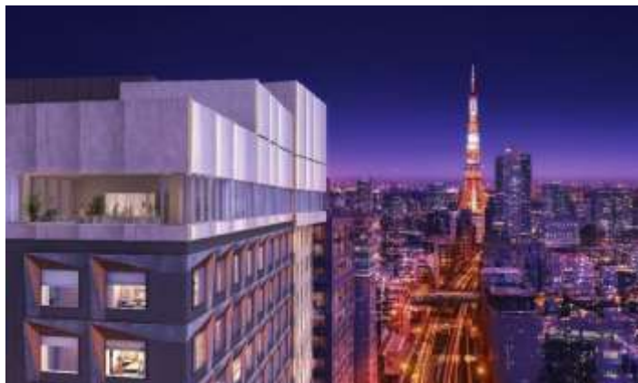
ホテルからの眺望(完成予想パース)