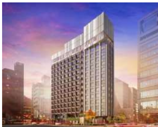
外観(完成予想パース)