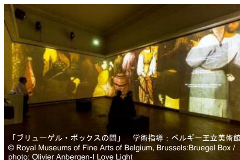
「ブリューゲル・ボックスの間」 学術指導：ベルギー王立美術館

ブリューゲルが好んだ群衆構図は、肉眼で詳細に観察することが困難です。それは、画面のいたるところに民家、農家、作業小屋があり、様々な人々が仕事をし、かなりの数の家畜や動物が人間と共存しているからです。また、悪魔や怪物の絵でも鳥類、爬虫類、楽器と人間を組み合わせた「奇怪な合成物」も、ぜん動しています。今回の巨大スクリーンによるスーパー解像度（Gigapixel）の映像空間は、これらの丁寧に描かれた群衆 1 人 1 人の性格や感情、彼らの持ち物や道具の深い意味、怪物尽くしの着想源などを紹介。鑑賞者にとって、“見たことがない”新次元のブリューゲルを発見するチャンスとなるでしょう。この映像は 2016 年 3 月からベルギー王立美術館「ブリューゲル・ボックスの間」で公開され、大変な評判となっています。同美術館長ミシェル・ドラゲ博士は当時、「テクノロジーのお蔭で、来館者と絵画の間に新しい対話が築かれ、多くの人々の目にこれまで隠されていた秘密が発見されるかもしれません」と述べました。