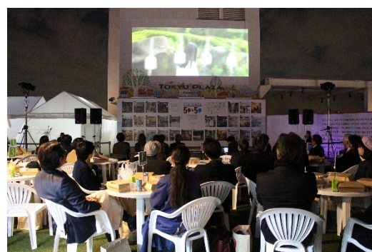
「50+50 LOVE KAMATA FAIR」イベントの様子

共同研究は蒲田という「地域の魅力」とは何かを定義することから始め、この定義に基づいて東急プラザ蒲田が取り組んだ施策の効果を検証しました。具体的にはまず、同施設が開業50周年記念で公募した短編小説479作品の中から優秀作に選ばれた75作品に自然言語解析を施し、蒲田のイメージや愛着の要素となる言葉を抽出して、それぞれの関係性が目で見て分かるようにネットワーク図を作成しました。